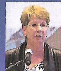
Delegationsleitung Bundesministerin a.D. Dr. Sabine Bergmann-Pohl